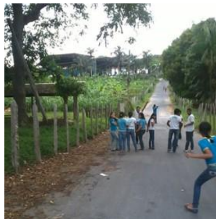
Figura 3 – Caminhada no entorno da escola