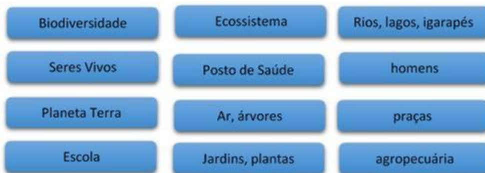
Quadro 1 – Mapa livre sobre as representações dos alunos sobre meio ambiente

Com as rodadas de conversas e as visitas ao entorno da escola, os alunos construíram coletivamente um esquema de palavras soltas que representariam as suas concepções sobre Meio Ambiente naquele momento.