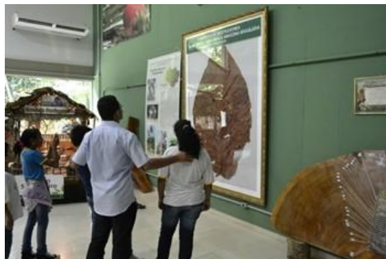
Figura 5 – Visita à casa da Ciência, no INPA

A casa da ciência foi o local onde eles passaram maior tempo observando e tirando fotos. Nesse local, podemos ver coleções de insetos, amostra de algumas espécies de peixes, anfíbios, frutos, sementes, casa do seringueiro, aspectos da história do Amazonas, dentre outras exposições. Os alunos, mesmo não podendo tocar na maioria das exposições, fitavam seus olhares no jacaré, cobra, arraia, borboletas, aranhas e nos aquários. A folha de dicotiledônea da Amazônia Ocidental, com 1,40m de largura e 2,50m de comprimento também chamou bastante atenção dos alunos.