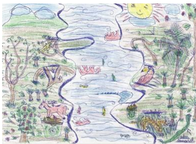
Figura 6 – Representações finais sobre meio ambiente

O relato do aluno D possui traços de um pensamento pragmático, de sustentabilidade, onde se pode utilizar o meio ambiente para a sobrevivência, mas com coerência, deixando em condições adequadas às gerações futuras. Os desenhos abaixo ratificam a predominância do pensamento conservacionista que inclusive é encontrado fortemente nos livros didáticos utilizados pelos alunos.