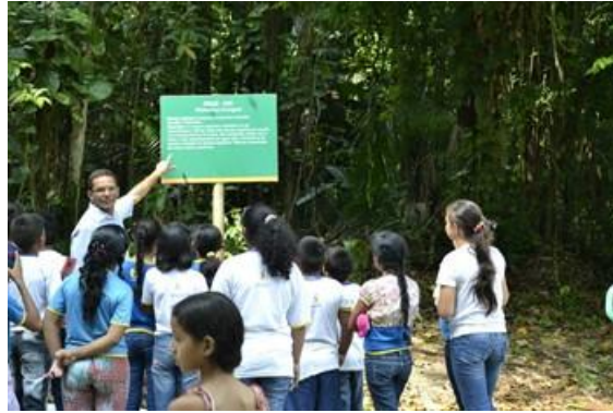
Figura 4 – Visita ao bosque da Ciência

Todos ficaram muito motivados ao saberem que visitariam o bosque da ciência; a maioria iria pela primeira vez. O objetivo principal seria que essa aula passeio não fosse caracterizada com o perfil e forma de ensino comum, como a da sala de aula. Estimularíamos a dúvida, criatividade, incertezas e a problematização, o que possibilitaria uma leitura mais crítica sobre o meio ambiente.