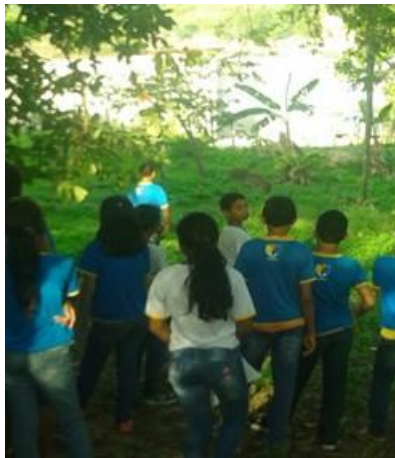
Figura 2 – Visita no lago do Aleixo

Curiosos e motivados para uma “aula diferente” nos entornos da escola, os alunos comentavam entre si que já sabiam o que tinha lá fora, inclusive que já haviam “fugido” da escola por aqueles espaços que percorreriam. Nos fundos da escola, existe uma área verde grande, com diferentes tipos de árvores, mas quase não explorada nas práticas pedagógicas conforme relato da pedagoga. A primeira parada chamou logo a atenção dos alunos. Visualizaram um homem dormindo embaixo de uma árvore e assustados, perguntaram-se: Ele está morto? O que ele está fazendo aí? Discutimos, então, algumas relações sociais presentes na sociedade como moradia, pobreza e cidadania. Ao discutir-se sobre esses aspectos, ainda mantinham seus olhos fitados no homem, seja por medo ou curiosidade. Ressalta-se a potencialidade deste entorno do colégio para o ensino de ciências. Inúmeras árvores são encontradas nesses espaços, como as que produzem goiaba, abacate, tucumã, taperebá, ingá, manga, dentre outras plantas, matos e animais. Como atividades pedagógicas poderiam ser confeccionadas estações que possibilitariam o conhecimento biológico das espécies de árvores, como também realizar momentos de observação, onde os alunos perceberiam as relações de interdependências entre os elementos bióticos e abióticos da natureza.